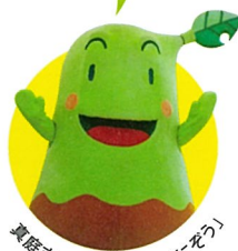
真庭市キャラクター「まにまに」