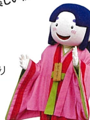
新庄村イメージキャラクター「ひめつ子」