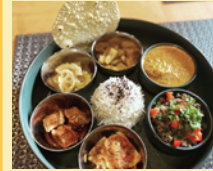
Spice Bar 升

岡山県の西粟倉村で活動する蜂蜜ブランド。オリジナル絵本をギフトボックスに詰めた百森蜜や、プレミアム蜂蜜グラノーラが人気。