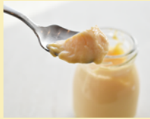
トラットリアケナル

人と食と茶を繋ぎ、茶会、教室、出店販売を各地にて実施。発酵によって様々な味、香りが違う台湾茶やセレクトした発酵食を販売。