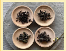
TE tea eating

カカオ豆と砂糖のみのシンプルなモノを作り、自分達で足を運んだ土地の作物を合わせたオリジナルチョコレートを生産。