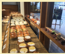
石窯パン工房 麦のひげ

SNSで人気沸騰中の総社市にある「bonbon.bread」をはじめ、岡山・鳥取県の人気パン店が集合。 岡山県：bonbon.bread(総社市)、おはようナーム(倉敷市)、石窯パン工房 麦のひげ(岡山市) / 鳥取県：スペイン石窯パンの家ボノス(鳥取市)、 ichibakery(大山町)、Boulangerie 麦ノ屋(米子市) ほか