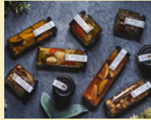
アトリエ&サロン はしまや

真庭市にあるチーズケーキ専門店。真庭の平飼卵を使用したベイクドチーズケーキは、やわらかな甘味とレモンの酸味が特徴。