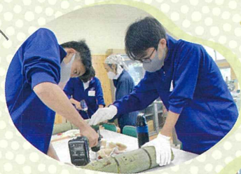
過去の竹灯り制作の様子 (岡山一宮高校2年生)

今年よるあかりで使用する灯籠は、真庭市立美川小学校3年生の児童の皆さんと、岡山県立岡山一宮高等学校の生徒の皆さんが制作に協力してくれました。手づくりの色鮮やかな灯籠と竹灯りが醍醐桜への路を彩ります。