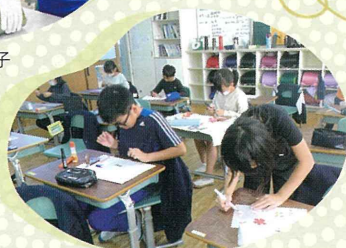
手づくり灯籠制作の様子 (美川小学校3年生)