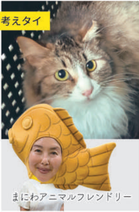
まにわアニマルフレンドリー