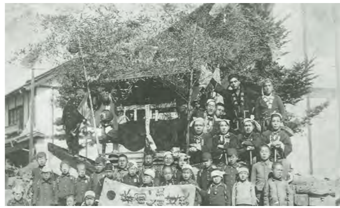
昭和17年～19年『中央社』 太平洋戦争時の金属類回収令により、だんじりの突先は鉄板ではなく木の突き組が写真右下に確認できる。