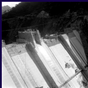
約3年間の建設期間