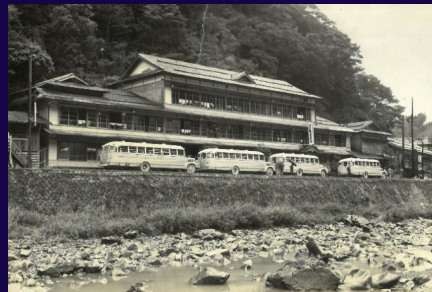
押し寄せる観光バス