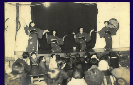
湯原音頭披露(大阪)