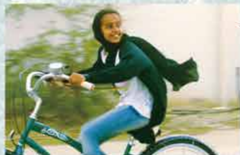
© 2012, Razor Film Production GmbH, High Lark Group, Refano Studios All Rights Reserved.

2012年/サウジアラビア・ドイツ/アラビア語/97分/ Wajida /監督:ハイファ・アル=マンスール 男の子との自転車競走を夢見る少女ワジダ。しかし、 サウジアラビアでは、女性が自転車に乗ることさえも禁 じられて……。サウジアラビア初の女性監督が困窮の中 に生きる少女を描く感動作。