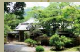
三浦邸(権ノ木御殿)